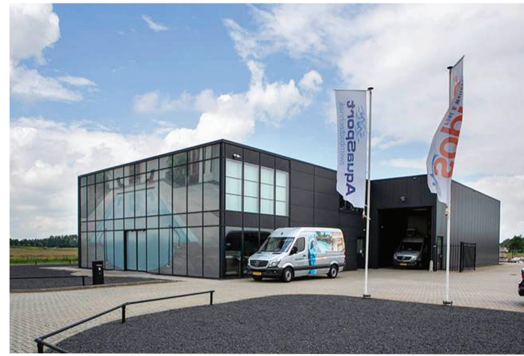
Het fraaie pand van AquaSport aan de Eeser Boulevard 19 op het bedrijventpark Eeserwold bij Steenwijk.

Een binnenbad creëren is namelijk als het gaat om techniek, het klimaat en de lucht- en waterkwaliteit geen sinecure. 'We worden dan ook graag al in een vroeg stadium uitgenodigd om een gedegen advies te kunnen geven. Zeker wanneer wordt gekozen voor een combinatie met wellnessfaciliteiten, zoals een sauna, whirlpool en/of stoomcabine', geeft Piepot aan. Eraan toevoegend: 'Daar horen logischerwijs ook een gedegen isolatieplan en een doordacht energie advies bij.' Belangstellenden zijn welkom aan de Eeser Boulevard langs de A32, waar persoonlijk kennis kan worden gemaakt met het team en de mogelijkheden van AquaSport. Unieke 'blauwwater' concepten zijn mogelijk voor zowel nieuwbouw als renovatie projecten.